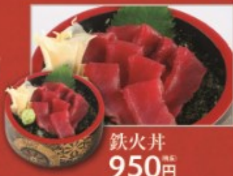
鉄火井 950円 (税別)