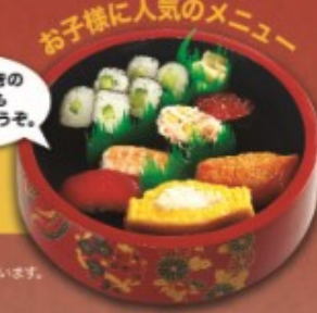
お子様に人気のメニュー