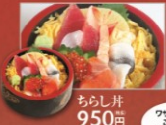
ちらし丼 950円 (税別)