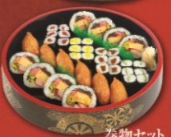
巻物セット 1,640円 (税別)