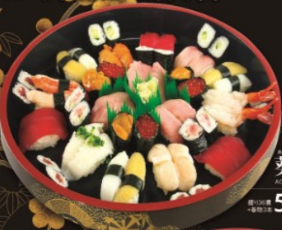
葵 6人前 AOI 6HINMAE