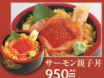
サーモン親子丼 950円 (税別)