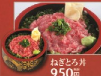
ねぎとろ丼 950円 (税別)