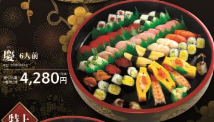
慶 6人前 KEI 6HINMAE