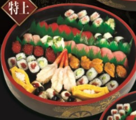
雅 特上 5人前 MIYABI tokujou 5HINMAE